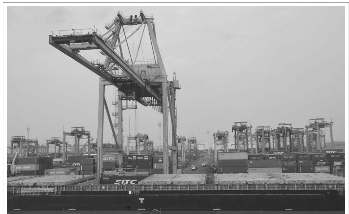
EKSPOR IMPOR INDONESIA SURPLUS : Suasana aktivitas bongkar muat peti kemas di pelabuhan Tanjung Priok, Jakarta Utara, Kamis (22/7/2021). Menko Perekonomian yang juga Ketua Komite Penanganan COVID-19 dan Pemulihan Ekonomi Nasional (KPCPEN) Airlangga Hartarto menyatakan ekspor dan impor Indonesia mengalami surplus selama 14 bulan berturut-turut sejak Mei 2020, termasuk pada Juni 2021 yang surplus 1,32 miliar dolar AS, tren tersebut menunjukkan aktivitas ekonomi di Indonesia terus berlanjut pulih.

Kemenperin mencatat, hingga 24 Juli 2021 pemerintah telah memberikan 17.919 IOMKI kepada total 16.670 perusahaan industri di wilayah Jawa-Bali. Sektor yang paling banyak mendapat izin beroperasi adalah industri kimia, farmasi dan tekstil (7.382 izin), industri logam, mesin, alat transportasi dan elektronika (6.023 izin), dan industri agro (4.992 izin). ● iwan/igro